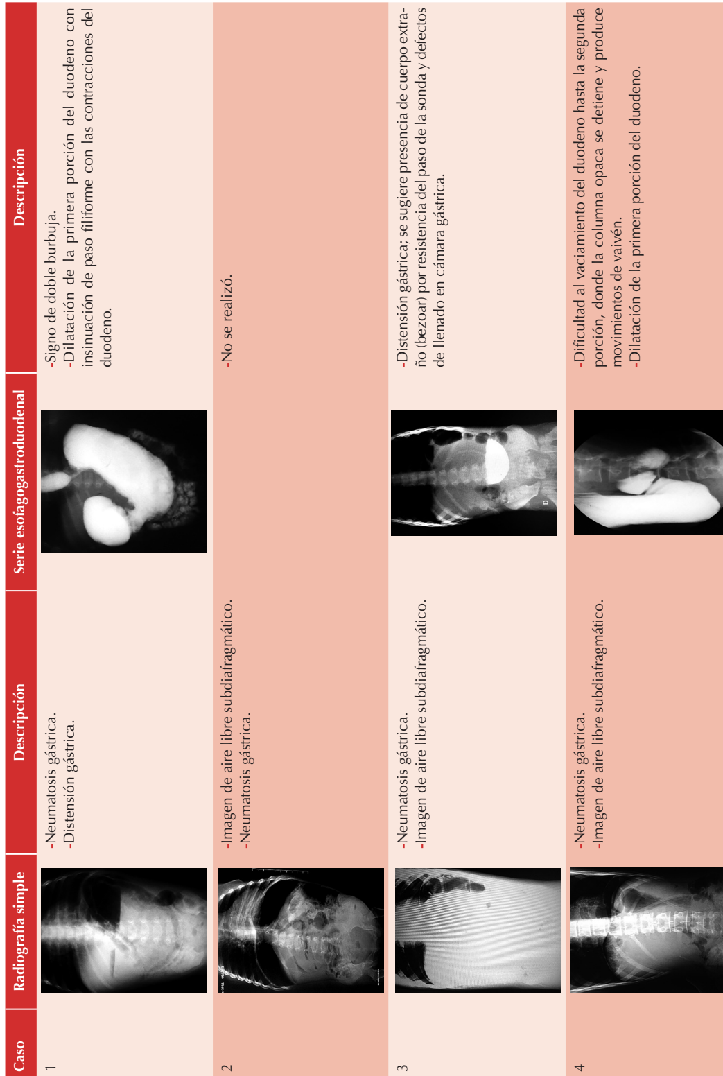
Cuadro 2. Radiografía simple de abdomen en bipedestación y serie esofagogastroduodenal de los cuatro casos reportados en el Hospital para el Niño Poblano, de enero del 2010 a diciembre del 2015, con diagnóstico de neumatosis gástrica