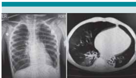
Figura 1. Caso 6: Radiografía de tórax con importante atrapamiento de aire y tomografía con patrón en mosaico y bronquiectasias, hallazgos característicos de la bronquiolitis obliterante post-infecciosa.