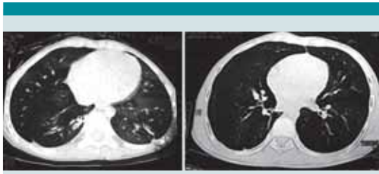
Figura 3. Caso 7: evolución de la tomografía después de 8 años con marcada mejoría.