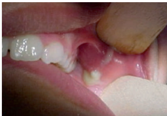
Figura 2. Salida de líquido purulento por el conducto de Stenon.

otalgia; malestar general, irritabilidad, anorexia, trismo, celulitis (edema, eritema y calor) de la piel circundante; por las carúnculas de la desembocadura del conducto puede salir espontáneamente saliva turbia o purulenta al realizar presión sobre la acumulación, por lo que el cuadro clínico recibe el nombre de sialoadenitis bacteriana aguda supurativa (Figura 2). 1,3,13,22 Usualmente, ocurren episodios inflamatorios repetitivos, separados por períodos asintomáticos y sin enfermedad sistémica acompañante, tres a cuatro veces por año, lo que hace al cuadro clínico un proceso crónico que da lugar a una sialoadenitis bacteriana crónica y recurrente. El aumento de volumen de la glándula se estabiliza con la consiguiente fibrosis del parénquima glandular que se manifiesta por una consistencia dura de carácter nodular de toda la glándula. 1,5,8 Cuando el cuadro es agudo se puede presentar de forma bilateral; en casos crónicos, casi siempre es unilateral.