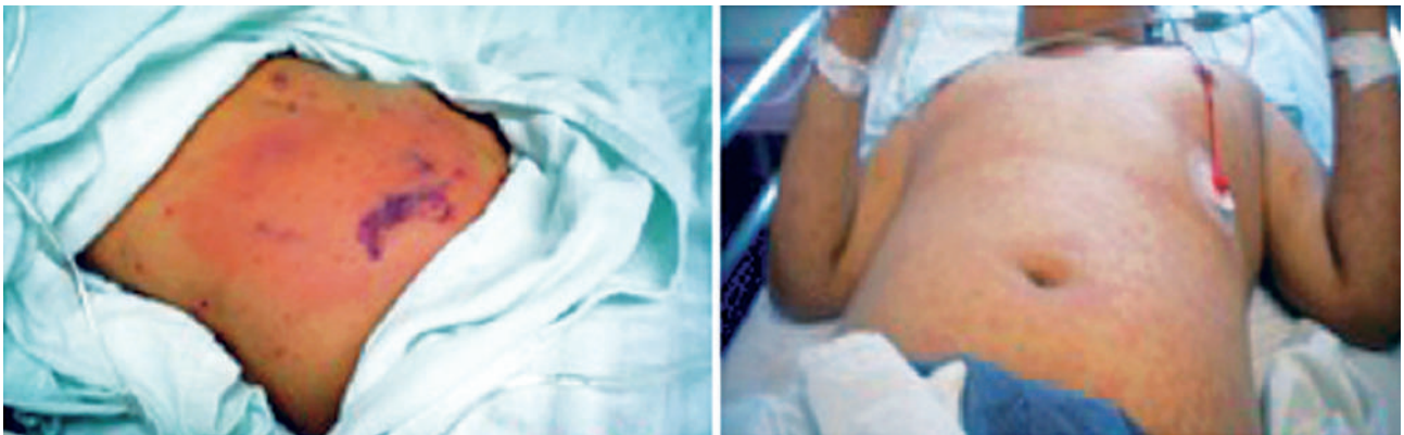
Figura 2. Enfermedad invasiva por SBHGA. A. Paciente con fascitis necrosante, caracterizada por necrosis local y síndrome sistémico grave. B. Paciente con shock tóxico, que muestra exantema con descamación.

La Academia Americana de Pediatría recomienda para el tratamiento de las infecciones invasivas por el SGA el uso combinado de clindamicina que inhibe la síntesis de proteínas a nivel de la subunidad 50s ribosomal, evitando así la formación de uniones peptídicas a 35 o 45 mg/kg/día por vía intravenosa cada seis horas, simultáneamente con la penicilina que inhibe la síntesis de mucopéptido de la