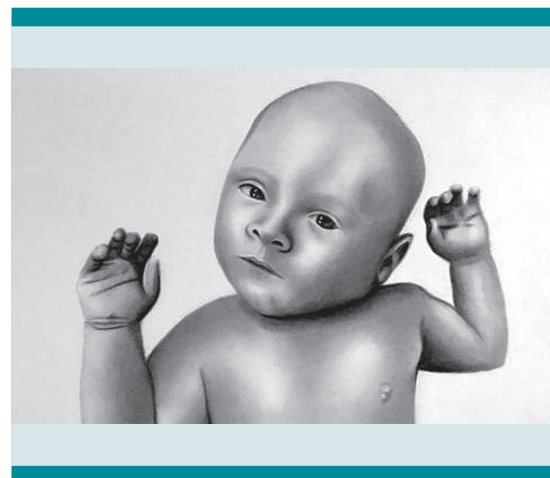
Figura 1. Esquema representativo de la postura típica, nótese la lateralización del cuello hacia el lado afectado y la rotación externa de la cara en lado contralateral, también se ejemplifica la plagiocefalia.

La limitación de la rotación de la cabeza hace que la cara del lactante descansa sobre el mismo lado de la lesión cuando el neonato se encuentra en decúbito prono, y sobre el lado opuesto del occipucio cuando se encuentra en decúbito supino, la presión resultante de apoyar siempre el mismo lado de la cara y el hueso occipital opuesto contribuye a las asimetrías facial y craneal. De tal forma puede encontrarse arco cigomático ipsilateral deprimido y occipucio contralateral aplanado. 9,10 Figura 1