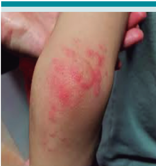
Figura 2. Máculo-pápulas de aspecto discoide sugiere de eritema multiforme. Tomado de Maqueda-Zamora A, et al. Manifestaciones dermatológicas de la infección por COVID-19 en Pediatría. Rev Clin Med Fam. 2020; 13 (2): 166-70.

Las lesiones pueden ser redondeadas, medir algunos milímetros y ser múltiples o afectar todo el dedo, casi siempre con una demarcación clara a nivel metatarsal. Al principio tienen un color rojo-purpúreo o azulado. Durante su evolución pueden llegar a tener bulas o costras negras; la mayor parte de las veces son dolorosas e involucionan en el transcurso de dos semanas, con desaparición completa. Estas lesiones pudieran ser la expresión de microtrombosis secundaria debida a daño endotelial y alteraciones vasculares. Las manifestaciones dermatológicas pudieran ser útiles para identificar niños y adolescentes con formas leves de infección, pero que son fuentes potenciales de contagio. 3 Figura 4