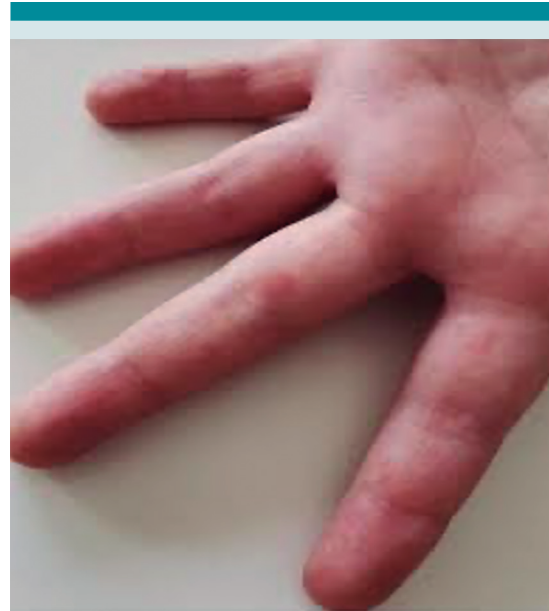
Figura 3. Pápulas eritematosas en dedos de las manos. Tomado de Maqueda-Zamora A, et al. Manifestaciones dermatológicas de la infección por COVID-19 en Pediatría. Rev Clin Med Fam 2020; 13 (2): 166-70.